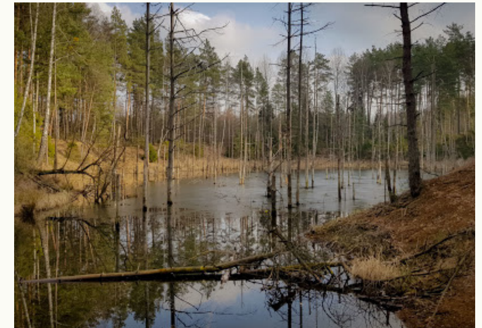
Żyglin - Żyglinek